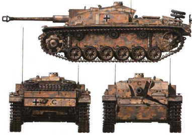
Sturmgeschütz Ausf F/B, de la Batería 98ª StuG, de la 10ª División Panzer en Túnez, Enero 1943